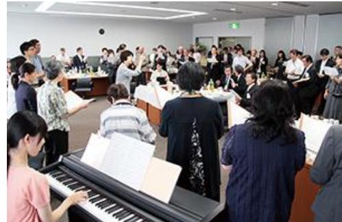
懇親会では草むら音楽隊と一緒に全員で合唱

お問い合わせ： NPO 法人多摩草むらの会 本部事務局 〒206-0034 東京都多摩市鶴牧 1-4-10 アネックス鶴牧 101 Tel: 042-339-8022 Fax: 042-339-8025 E-Mail: info@kusamura.org Web: http://kusamura.org