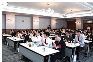
決議事項は満場一致で可決されました