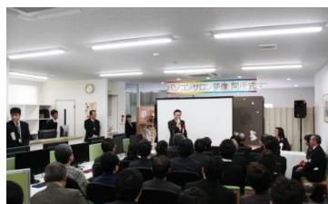
多くの来賓から祝辞をいただきました